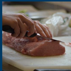
Alle Informationen unter Vorbehalt! Es gelten die Bestimmungen der jeweils gültigen BbS-VO.

In der Klasse 11 ist ein Praktikum von 960 Zeitstunden in geeigneten Betrieben zu absolvieren. Es findet an drei Tagen in der Woche statt. Die Schule übt die Aufsicht über die Durchführung der praktischen Ausbildung aus.