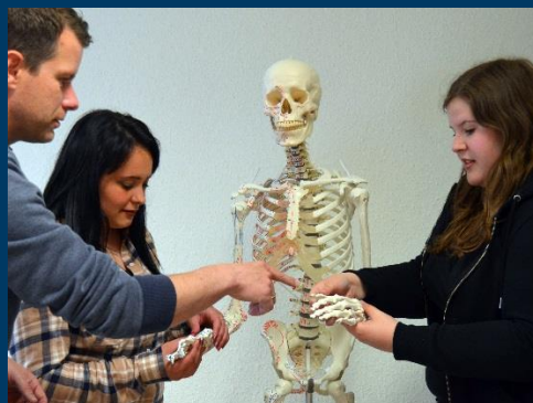
Alle Informationen unter Vorbehalt! Es gelten die Bestimmungen der jeweils gültigen BbS-VO.

In der Klasse 11 ist ein Praktikum von 960 Zeitstunden in geeigneten Betrieben zu absolvieren. Die Schule übt die Aufsicht über die Durchführung der praktischen Ausbildung aus.